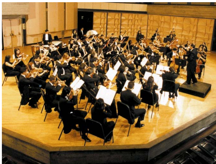
(Orquesta sinfónica de Antofagasta, Chile)

Cuarteto: Obra escrita para cuatro partes, sonata para cuatro instrumentos.